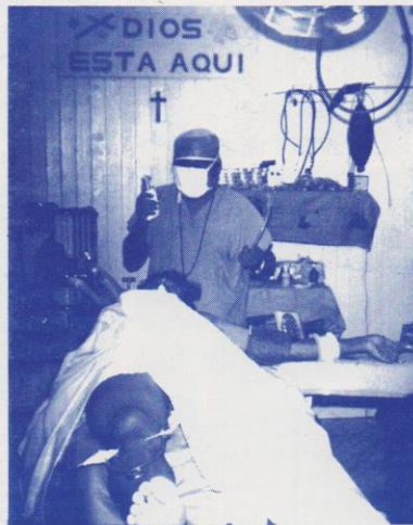
HOSPITAL AGUACATE, 1987 Sala de Cirugía de Hospital Contra. "Dios está aquí". Un anestesista, un herido.

Los fondos generados por MMT son, en su mayoría, donaciones de sus mismos miembros. Sin embargo, como nosotros estamos envueltos en grandes operaciones internacionales, necesitamos gran cantidad de donaciones, tales como medicinas, equipos médicos, y donaciones monetarias para poder embarcar los materiales. Nuestros doctores costean sus propios gastos, tales como pasajes, estadía, comidas, etc. Así lo han estado haciendo por espacio de ocho años. Ellos también donan los pasajes y gastos de estadía y comidas del personal de enfermería y técnicos que se encuentran viajando en dichas misiones. Nos sentimos muy orgullosos de este grupo de hombres y mujeres por el buen trabajo que han desempeñado alrededor del mundo, en nombre de la libertad, salud pública, y también con el objetivo de tener una Cuba libre.