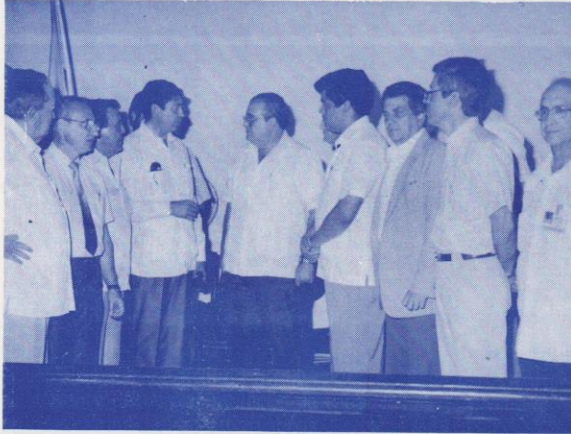
PANAMA, ENERO 1990