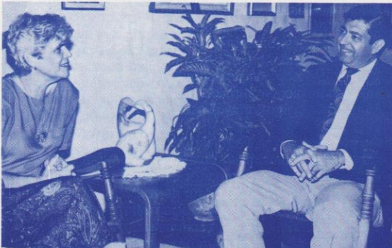
MANAGUA, NICARAGUA, MARZO 1990