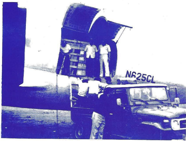
HONDURAS, MARZO 1984

C47 usado en transporte de medicinas y equipos médicos por el MMT a los Contras en Honduras.