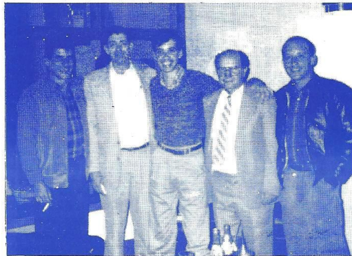
SAN JOSE, COSTA RICA. 24 ENERO 1991

ellos creen que más pronto que tarde, se presentarán cambios en Cuba hacia la democracia, y entonces podremos trabajar juntos en la reconstrucción de la patria.