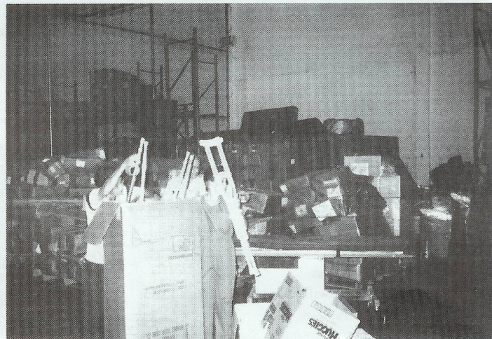
MMT Warehouse in Miami, Florida. (All Kind of Equipment and Hospital Supplies).

Dengue Epidemy in El Salvador, C.A. Year 2003