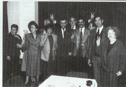
MMT in Varsovia with Senator Stepien of Solidarity. Year 1993