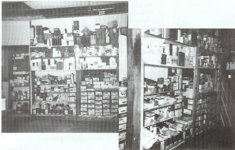
MMT Pharmacy: All medications, organized and classified, ready to dispatch.