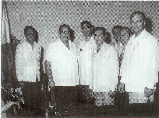
Leaders of MMT with President Guillermo Endara of Panamá. Year 1991