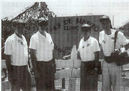
Base Naval de Guantánamo. Cuban rafters crisis. Year 1994.