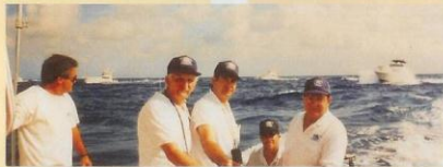
Flotilla frente a las costas cubanas