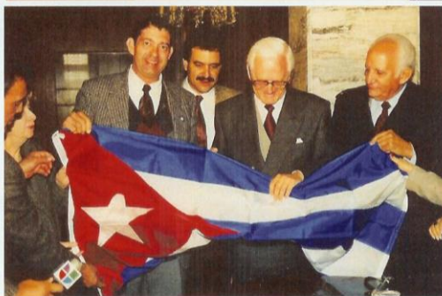
The MMT has been in 24 countries rendered humanitarian services and its leaders have met with leaders of several countries