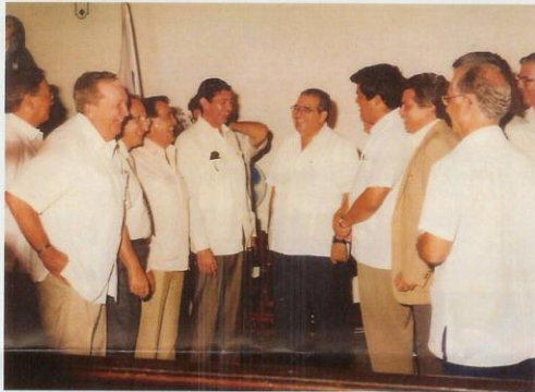
In Panama, with President Endara