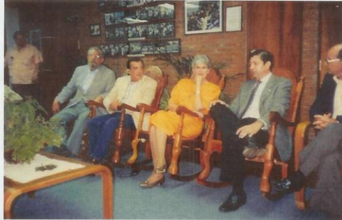
Meeting with President Chamorro of Nicaragua