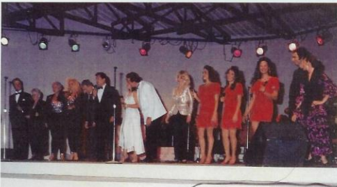
Humanitarian and spiritual support to Cuban refugees. Also artistic events.