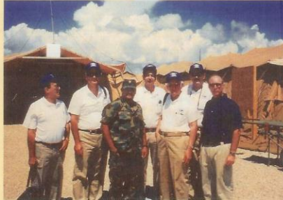
In the United States Naval Base in Guantanamo

Toda la labor realizada ha sido financiada por los miembros del MMT.