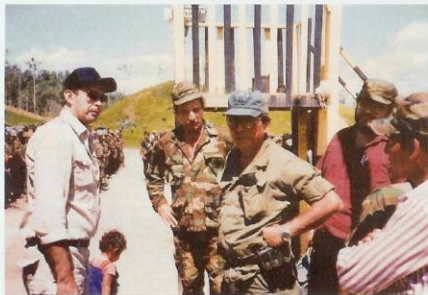
MMT in Nicaragua