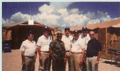
En la Base de Guantánamo