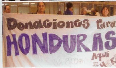
Principal Centro de Recogida en Miami