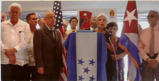
Conferencia de prensa en Miami iniciando el proyecto ¡Ayudemos a Honduras!