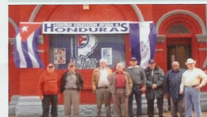
Sede de la Unión de Ex Presos en New Jersey