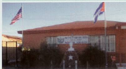
La sede de los Municipios de Cuba en el exilio también fue un importante centro de recogida.

Así pues, se establecieron 17 Puntos de Recogida en Miami. Un almacén de empaque con 12 vehículos de transporte locales.