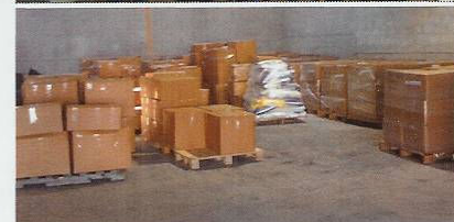
La labor en el almacén fue de fundamental importancia