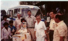
Ayuda humanitaria a otros países