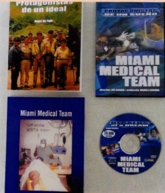
Libros y DVDs del Miami Medical Team