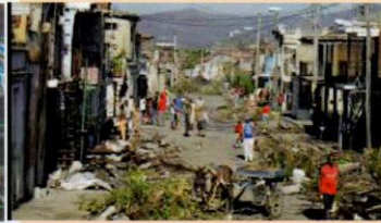
Destrozos ocasionados por el huracán Sandy en las provincias orientales de Cuba.