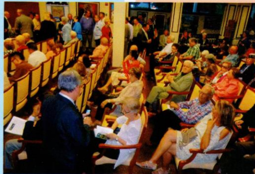
Vista parcial Casa Bacardí.