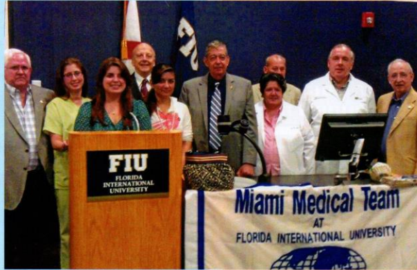
Miami Medical Team con grupo de estudiantes en el recinto de Florida International University.

En el mes de diciembre se entregaron medicamentos para enviar a Matanzas, Las Villas y Pinar del Río. Se prepara el envío de al menos un contenedor con el Padre Alejandro a Choluteca en Honduras y otro tanto a Tegucigalpa, Honduras. Continúa la ayuda en comida y medicina a Belize en forma cíclica.