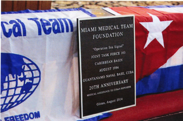
Placa del MMT a la Base.