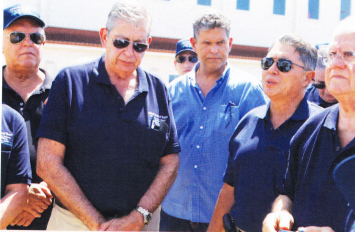
Visita a la Virgen de la Caridad del Cobre