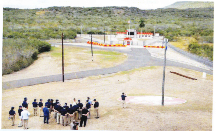
Puerta a Cuba