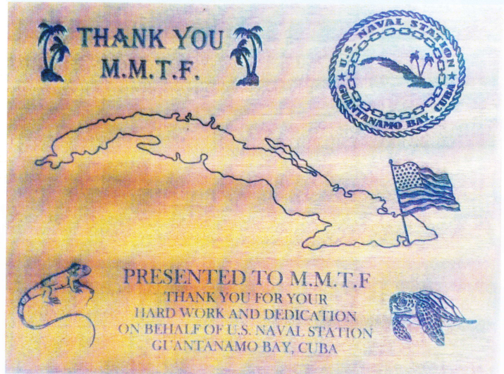
Placa al MMT.