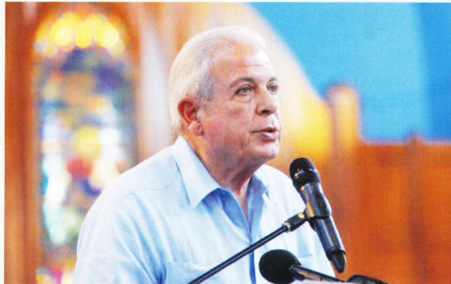
El Alcalde de la ciudad de Miami, Tomás Regalado.