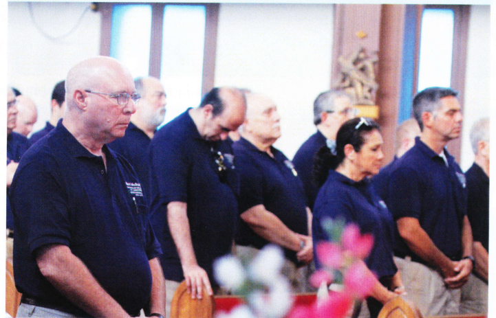
Capilla: Himno Nacional Cubano.