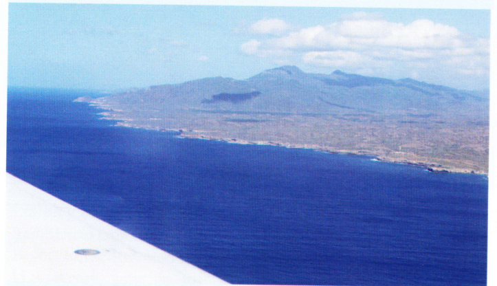
Vista aérea de Guantánamo Base Naval