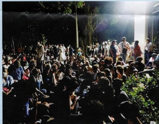
Protesta nocturna frente el Ministerio de Cultura

Ha habido huelgas de hambre, palizas por la Seguridad del Estado, detenidos, etc. y sigue incrementándose la protesta pidiendo una Cuba libre.