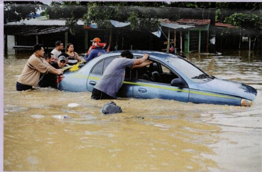
Huracanes causan destrozos e inundaciones en Centroamérica